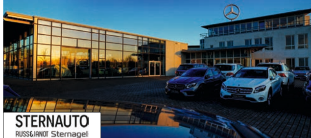
STERNAUTO RUSS&JANOT Sternagel

Die Stern Auto GmbH ist eine der größten Automobilhandelsgruppen Deutschlands. In Punkto Mobilität betreut sie in 6 Bundesländern an 23 Standorten im Raum Berlin, Dresden, Leipzig, Magdeburg, Rostock und Schwerin, sowie mit RUSS&Janot in Erfurt und Sternagel in Potsdam. STERNAUTO ist ein Mehrmarkenhändler und bietet Privat- sowie Geschäftskunden eine Auswahl vom eRoller bis zum LKW.