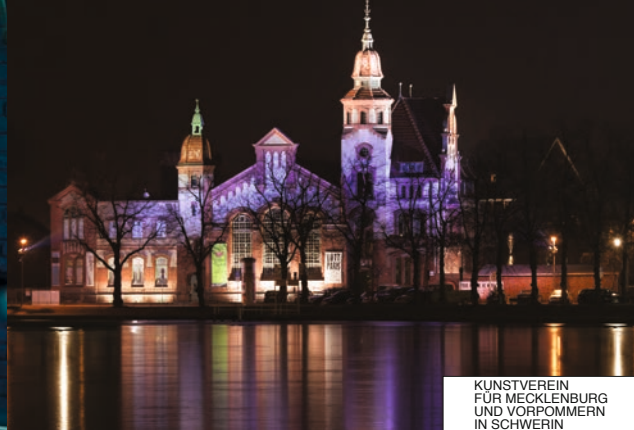
KUNSTVEREIN FÜR MECKLENBURG UND VORPOMMERN IN SCHWERIN

Haltestelle Marienplatz, Brunnenhof – in den Schweriner Höfen